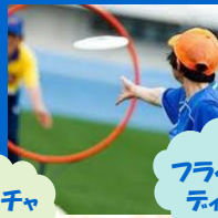
フライング ディスク