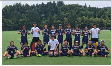
* 企業チームやクラブチームを応援します！

社会人スポーツの振興に寄与することを目的とし、社会人スポーツ推進企業の認定や強化支援事業の実施、優秀選手等の確保に取り組んでいます。