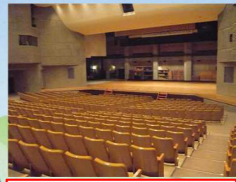
【開始式・表彰式会場】 妙高市文化ホール 所有者: 妙高市