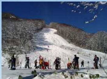
【アルペン(GS)競技会場】 赤倉観光リゾートスキー場 所有者: 株式会社赤倉観光ホテル