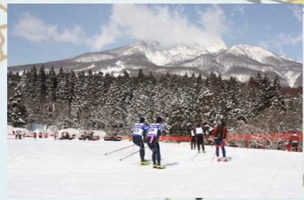
【クロスカントリー競技会場】 赤倉観光リゾートクロスカントリーコース 所有者: 妙高市、株式会社赤倉観光ホテル 他